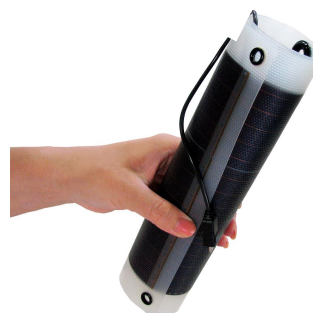
手で巻いて簡単に持てる柔らかい 100g ソーラーシート