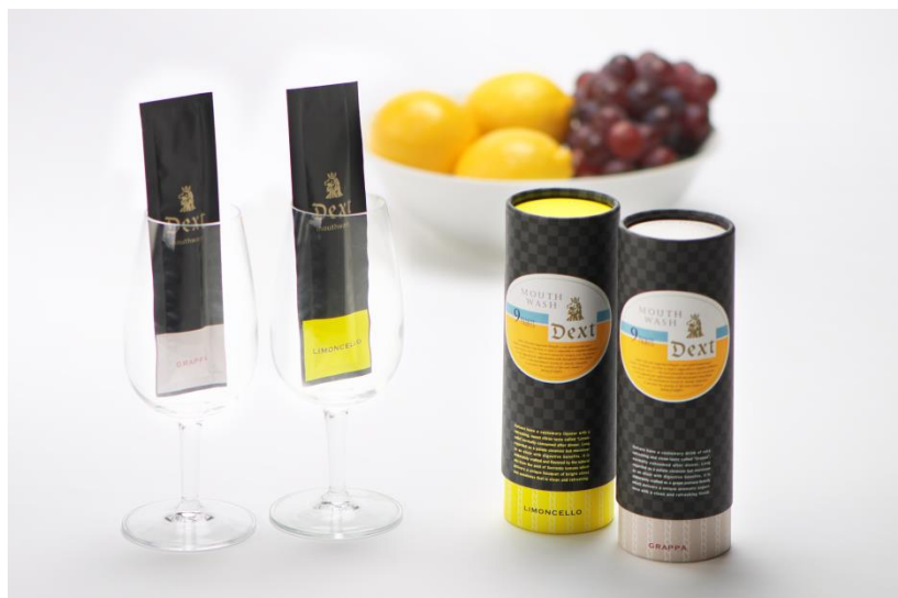
※Dext MOUTH WASHは飲み物ではありません。

「Dext MOUTH WASH(9ml・1回分×9包/1,600円+税)」は、イタリアの文化である食後酒のLIMONCELLO(リモンチェッロ)とGRAPPA(グラッパ)をイメージした2種類をラインナップ。さらに、手軽に持ち運びできサクッと使える分包タイプの、今までにないマウスウォッシュです。営業やデートの前、食後など、オンでもオフでも幅広いシーンを爽快感で彩ります。