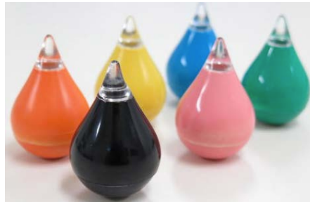
株式会社 Braveridge Bluetooth Smart ビーコン