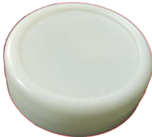
ホシデン株式会社 Bluetooth Smart ビーコン