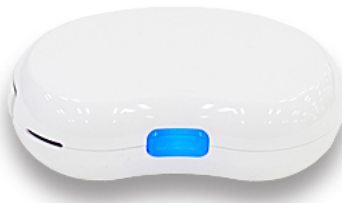
丸紅情報システムズ株式会社 Bluetooth Smart ビーコン

Bluetooth low energy, Bluetooth Smart について(英語サイト) tinyurl.com/BluetoothLE