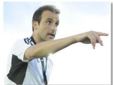
元リアル選手によるトレーニング実技講習

応募方法：右記申込ページから（ http://p-ground.com/c/?p=shukatsu ）