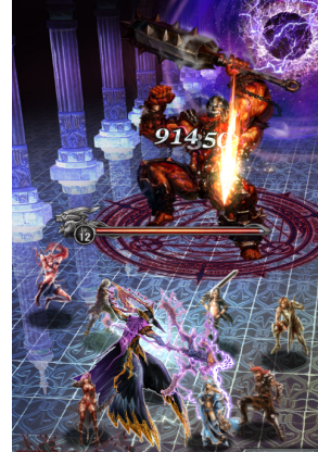
白熱のレイドバトル