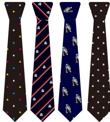
※画像は商品イメージです

新しくラインナップしたのは、第 1 弾でも大人気のロイヤルクレスト柄と小紋柄のストームトルーパー、R2-D2 は X-WING でも好評だったクレスト柄の計 4 種。発売中のスター・ウォーズビジネスグッズ(ネクタイピン、カフス、名刺入れ)とあわせて使いたい、マニア心くすぐるアイテムです。