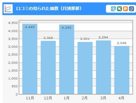
「みんなの口コミ分析」画面一例