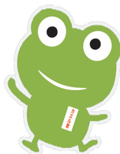
【手ぶらでカエル君】

株式会社Q配サービスは、軽四輪を中心とした定期・専属配送のアウトソーシング会社です。お買い上げ品お届けサービス「手ぶらでカエル君®」だけでなく、日本全国で製造業、卸売業、サービス業他多くの業種で弊社アウトソーシングサービスをご活用いただいております、常時約3,000台が稼働しています。