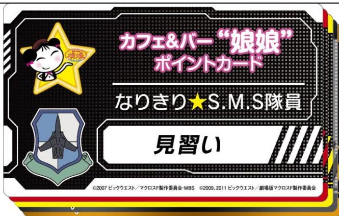
画像は開発中のイメージです

マクロス F の世界観を演出した店内に、大型スクリーン(183inch)とモニター(9台)を設置。キャラクターオリジナル編集の、マクロス F 特別映像をお楽しみいただけます。