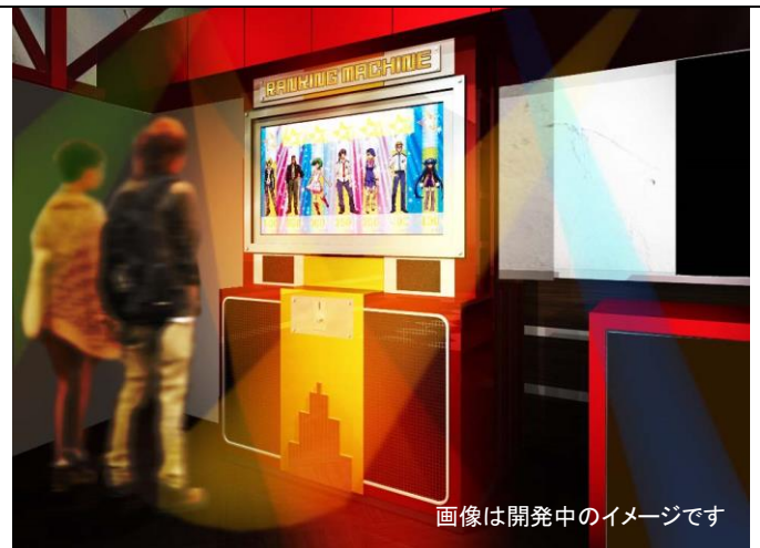
画像は開発中のイメージです