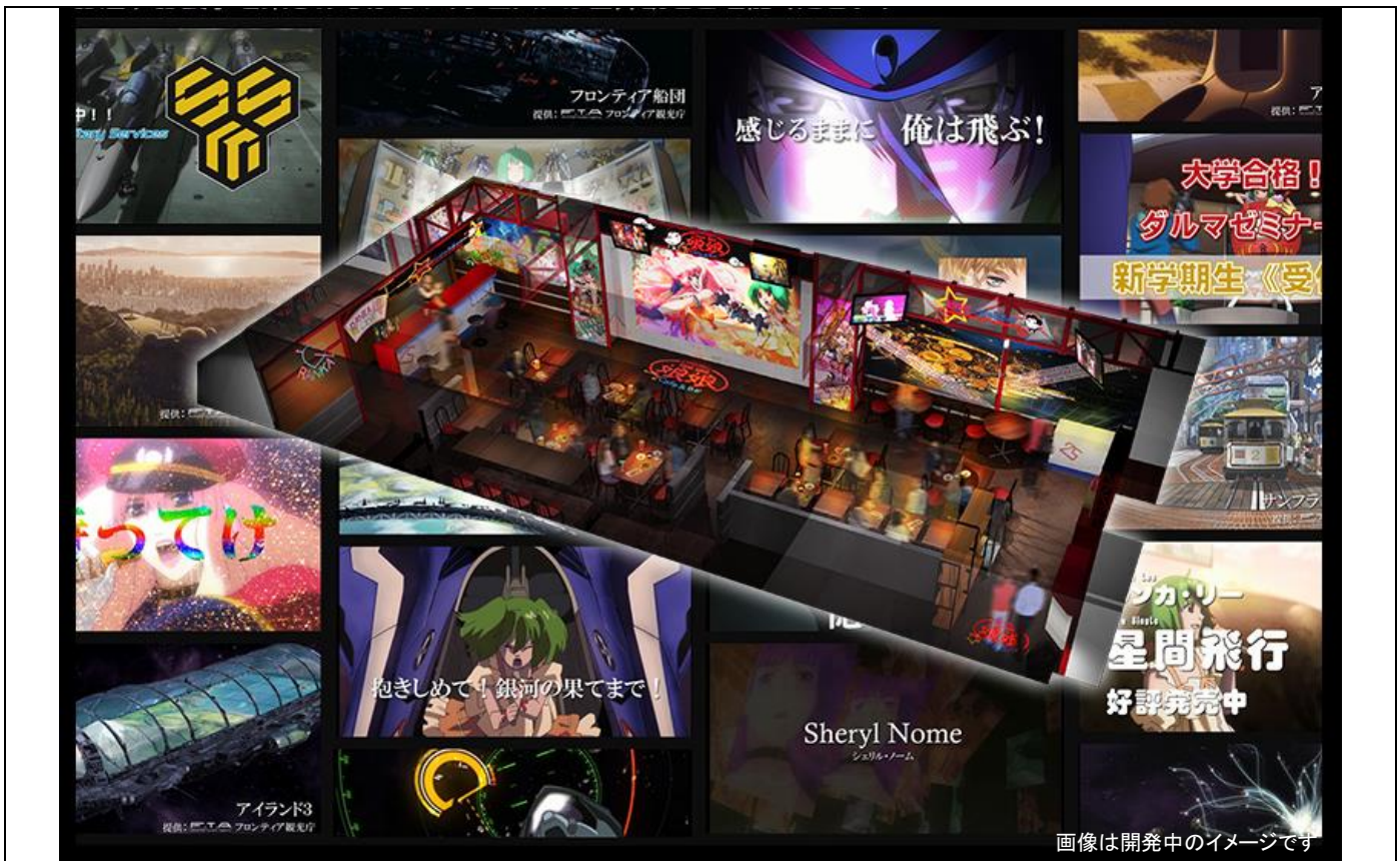
画像は開発中のイメージです