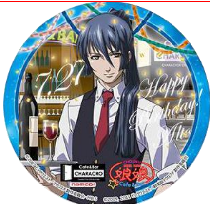
「早乙女アルト誕生祭」限定コースター