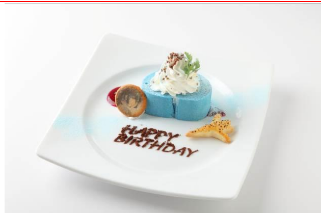
アルトのバースデーケーキ 1,000円(税込)