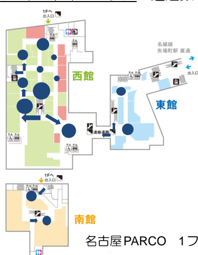
名古屋 PARCO 1フロア水平動線