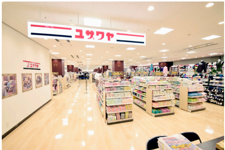
「ユザワヤマーケット」リアル販売会を行うユザワヤ吉祥寺店

今回「ユザワヤマーケット」にて販売を行っているハンドメイドクリエイターの方に、主婦を中心としたハンドメイドファンに抜群の知名度がある「ユザワヤ」にて販売機会を提供することで、一般の方にはまだまだ知られていない素敵なアイテムを発掘・お披露目するとともに、ハンドメイドクリエイターの方の販売力や宣伝に繋がればと考えております。