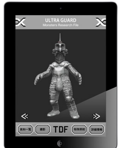
タブレット端末に表示したバーチャルフィギュア

第 1 弾の「TDF Monsters Research File」は、特撮 TV 番組『ウルトラセブン』に登場する地球防衛軍(TDF)の精鋭「ウルトラ警備隊」隊員だけに使用を許された秘密の怪獣調査ファイルという設定で、怪獣たちのバーチャルフィギュアを配信します。カプセル怪獣ウインダムや、宇宙怪獣エレキングといった人気怪獣が最新技術で続々と目の前に現れます。