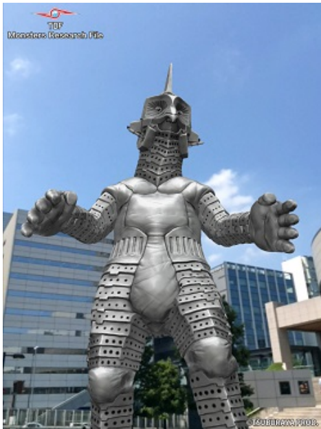
バーチャルフィギュアの撮影例