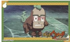
付属のステッカー (1枚)