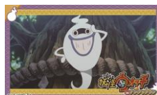
付属のステッカー (1枚)

「あ〜ける、あける〜」と、どんぶりから何やら声が聞こえてくるような気が... 開けてみると、ホワイトソース餃子丼が、ウイスパーに取り憑かれてる!? 是非食べてみて欲しいです、ウイス!