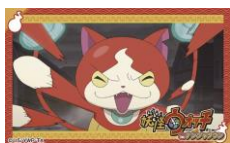
付属のステッカー (1枚)

餃子にチーズやハムなどの具材を乗せたら、ジバニャンが現れた! これ、めっちゃ美味しいニャン。オレツちにくれニャン!