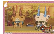
付属のステッカー (1枚)