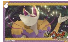
付属のステッカー (1枚)