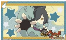
付属のステッカー (1枚)

妖魔界のエリート妖怪であるオロチがオーラで作りに出している龍のマフラーが餃子になってしまった! チーズの雷と一緒にやまたの餃子オロチを食べて、君もオロチチャージしよう!