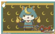
付属のステッカー (1枚)