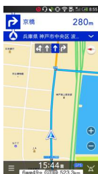
快適な地図スクロール