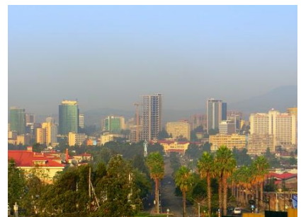
首都アディス・アベバの町並み