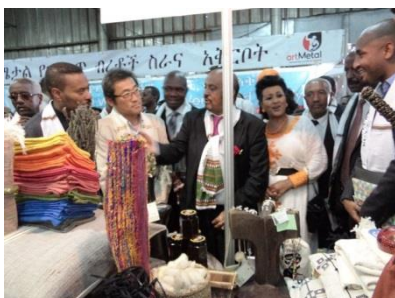
昨年度展示の様子 (JICA 出展ブース)