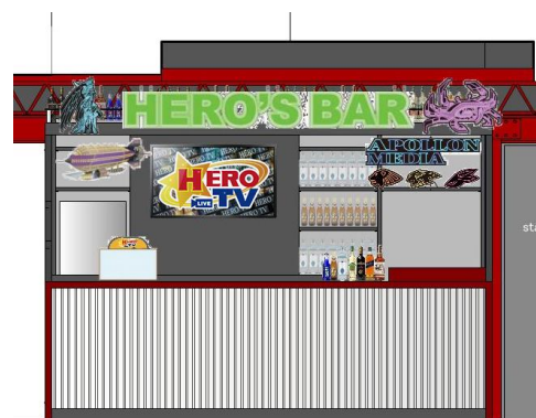
画像は開発中のイメージです。