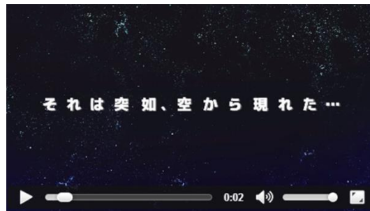
（それは突如、空から現れた…）