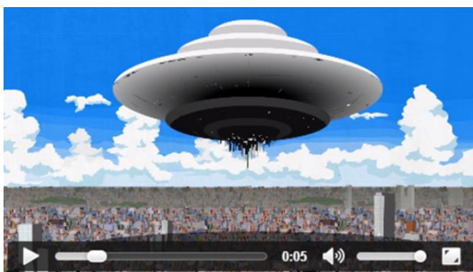
吉田「やつらの目的は、一体なんなんだ！」