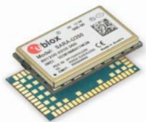
ユーブロックス社の SARA-U260 3G/2G モジュールが AT&T ネットワークにより認定

～ユーブロックス社の SARA-U260 3G/2G モデムが 3G への低価格移行を加速～