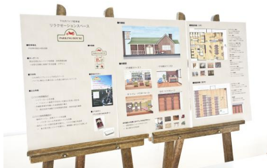
-バイク駐車場の企画書と会場内の展示パネル-