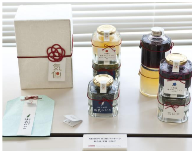
—学生が提案した「新しいバイク駐車場」(画像: 上)と 「気仙エリアの物産ブランドロゴ&ギフトパッケージデザイン」(画像: 下)—

今回の取り組みは、若い学生のアイデアで地域を活性化させたいと考えるしもきた商店街振興組合と、在学中から社会の課題と向き合い、“デザインのチカラ”で解決を目指すことで即戦力人材の育成を実現したいと考えるバンタンが共感し、実現に至りました。