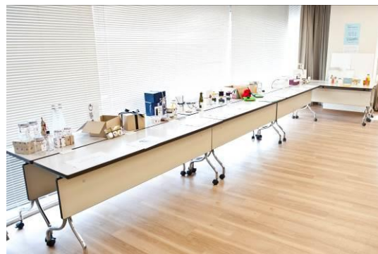
-デザインしたロゴとパッケージで商品サンプルを制作し会場内で展示-