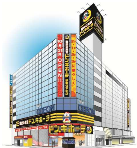
「ドン・キホーテ伊勢佐木町店」外観イメージ