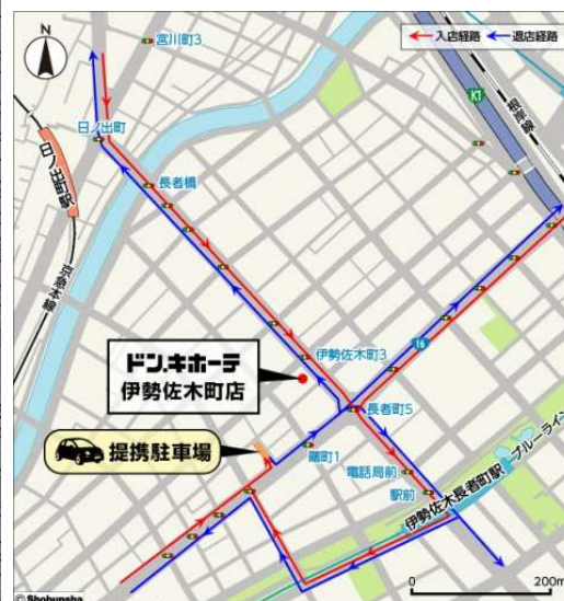
「ドン・キホーテ伊勢佐木町店」 提携駐車場 入退店経路図