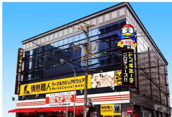
「驚安堂 日ノ出町店」外観イメージ