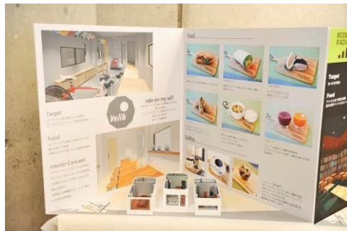
ブランド名:『Velib(ペリブ)』 ロードバイク好きな方に贈る交流型のカフェ空間 カフェオーナー研究科 及川光陽