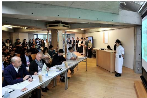
-Food Design Collection2014 のイベントロゴと会場の様子-