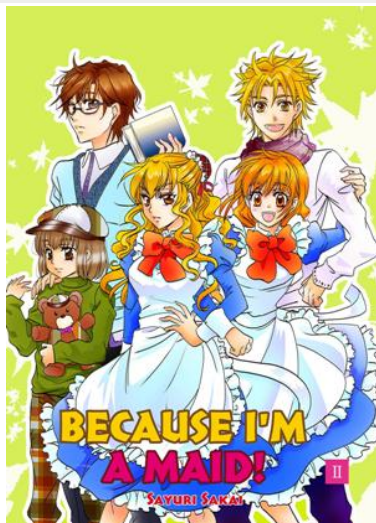
英語版 BECAUSE I'M A MAID! 2巻

2014 年、宙(おおぞら)出版 NextcomicsF レーベルより単行本「メイドですから！」1 巻を刊行。