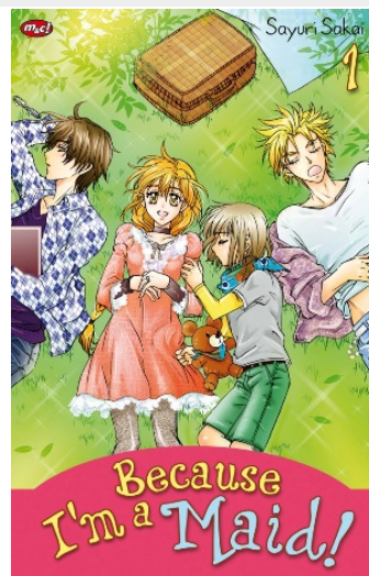
インドネシア語版 BECAUSE I'M A MAID! 1巻