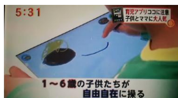
フジテレビ「スーパーニュース」