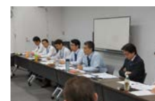
会議でも再発防止を徹底

当社トラックなど3台が関係する多重衝突事故が発生(死者2名、負傷1名)。再発防止・安全運行に向けての確認会議、緊急対策をグループ全体で実施