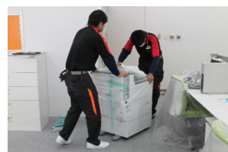
オフィスプリンタの設置・配線

さらにSBS ロジコムは、移転や引越作業だけをお請けするのではなく、プロジェクトマネージャーとして社内調整から各種手配、クレーム対応など煩雑な手続きや細かな作業を代行することで新体制作りを応援いたします。