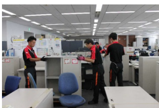
基本中の基本、什器の正確な設置

例えば、当社のオフィス移転は、机や椅子といった什器を運ぶ・動かすだけではなく、全体計画の立案から電話・電気・LAN配線や間仕切り工事の手配、情報機器・什器などの調達、不要になった家具の買い取りやリサイクルまでトータルサポートいたします。