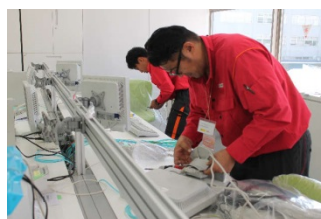
LAN配線・パソコンの設定