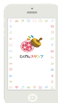
アプリ「じげんスタンプ」 トップ画面イメージ