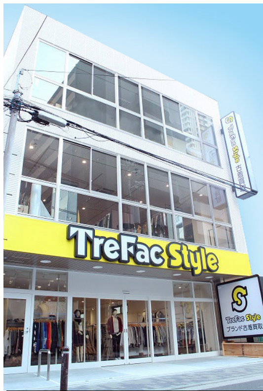
トレファクスタイル アメリカ村店 外観

首都圏を中心に23店舗を展開する「トレファクスタイル」は、関西地区への出店拡大のため、関西では2店舗目、大阪では初となる「トレファクスタイル アメリカ村店」をオープンいたします。関西の若者文化をリードしてきたアメリカ村の三角公園のすぐそばに位置し、四ツ橋駅から徒歩2分、心斎橋駅からも徒歩約4分とアクセスも便利な好立地に出店いたします。店内はレギュラータイプのファッションアイテムを販売する1階と、ブランドアイテムを中心に販売する2階の2フロアー構成で、約1万アイテムを販売いたします。レディースアイテムを豊富に揃え、着る人を限定しない幅広いジャンルを取り扱ってまいります。