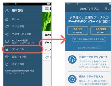
プレミアム登録画面 (スマホアプリ)