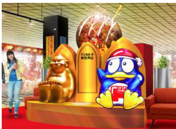
ビリケンとドンペンの記念撮影スポット

なお、この度の出店により大阪府のドン・キホーテグループ店舗は23店舗、そのうちMEGA業態は6店舗の出店となります。