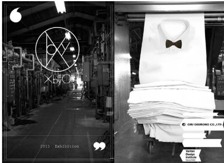
-「XbyO」展示会 DM デザイン-