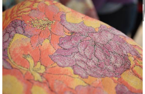
-2014年3月に行なった展示会の様子(左)、学生と協同で開発した、“織物”では難しいとされるグラデーション生地(右)-