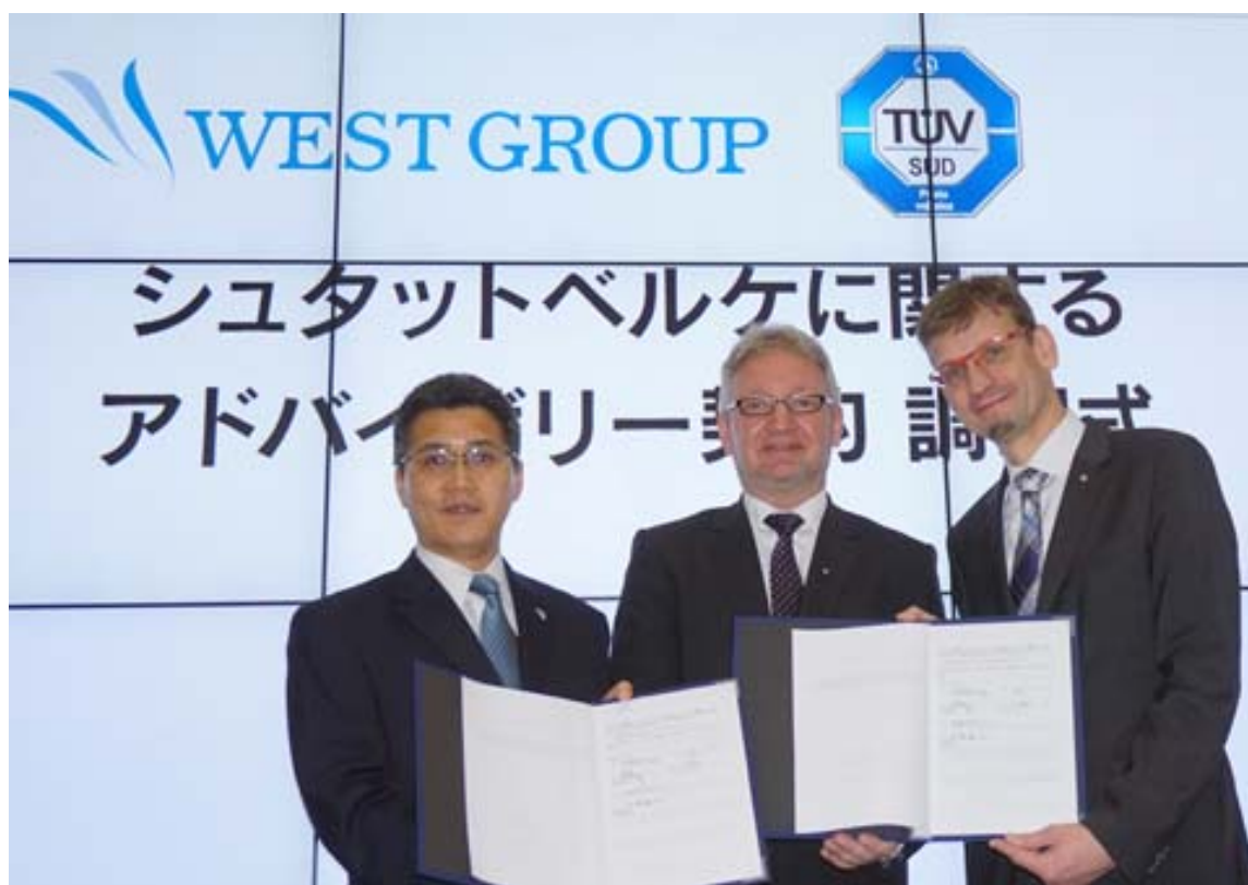
2月26日調印式の様子