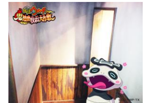
記念写真フレームイメージ

https://www.namco.co.jp/tp/namja/namjamypage/index/select