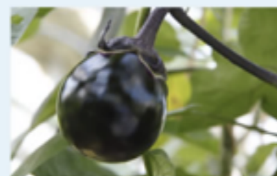
京都府産賀茂ナスエキス (整肌成分)

静岡県の西伊豆で有機栽培されているワケモノの葉から抽出したエキスには美肌作用や肌ダメージの原因を除去する効果、コラーゲンをサポートする効果があると言われています。