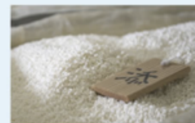
秋田県産の米ぬか発酵エキス (整肌成分)

京都府の伏見で有機栽培されている賀茂ナスエキスは高い栄養価を持つ野菜として知られています。果実から抽出したエキスには美肌作用や保湿効果、還元作用があると言われています。