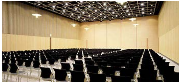
プレゼン発表会の会場となる秋葉原コンベンションホール