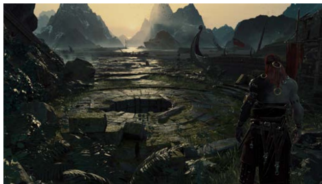
個人でもハイレベルなグラフィック表現が可能に

2015 年 3 月にリリースされた Unity 5 Personal Edition はプロのゲーム開発の現場で使われている Unity 5 Professional Edition と同等の機能が搭載された無料のライセンスです。イメージエフェクトや新しい GUI、ヘッドマウントディスプレイへの対応など、Unity 5 から利用可能となった多くの新機能を駆使してあなただけのオリジナルゲームを開発してください。