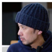
プロデューサー 高山 宏司

2000年生まれ。2012年、新潮社の中学生向けファッション誌「nicola（ニコラ）」の第16回モデルオーディションで、グランプリに輝く。以来、同誌の専属モデルとして人気を集める。