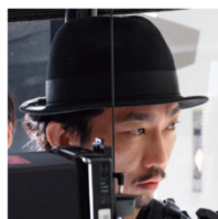
撮影監督 山田 真也

AI「ハピネス」、RADWIMPS「会心の一撃」、東方神起「Time Works Wonders」