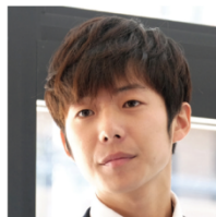
講師役 水間 ロン

2000年生まれ。2012年、ドラマ『13歳のハローワーク』にレギュラー出演。同年、映画『るろうに剣心』に、少年剣士・明神弥彦として出演。2015年、ドラマ『風の峠〜銀漢の賦〜』で、主人公・日下部源五の若き日を演じた。