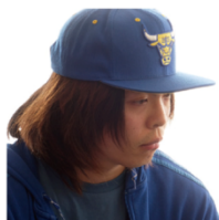
映像監督 大久保 拓朗

きゃりーぱみゅぱみゅ「PONPONPON」、ゆず「LAND」、RADWIMPS Live & Document 2014「×と〇と君と」