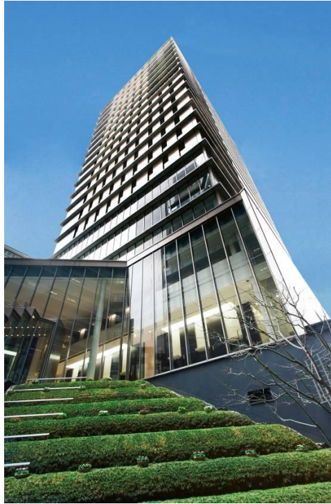
<毎日インテシオ ビル外観>