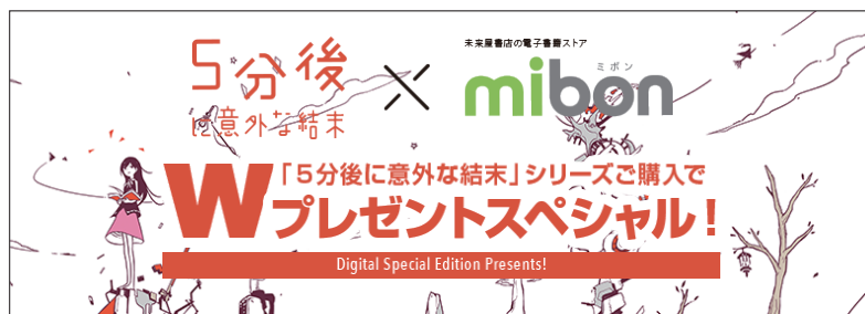
※キャンペーンバナー

未来屋書店では今後も、mibon ストアの仕組みを活かして、実店舗店頭の商品とデジタル特典を組み合わせた取組みを推進していきます。