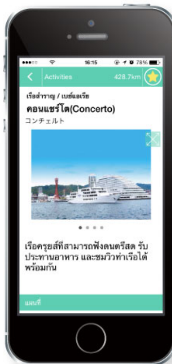
< 神戸エリア >