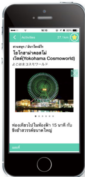
< 横浜エリア >