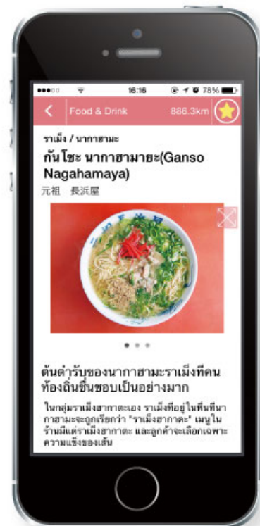
< 福岡エリア >