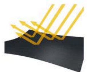
「熱遮蔽」イメージ画像