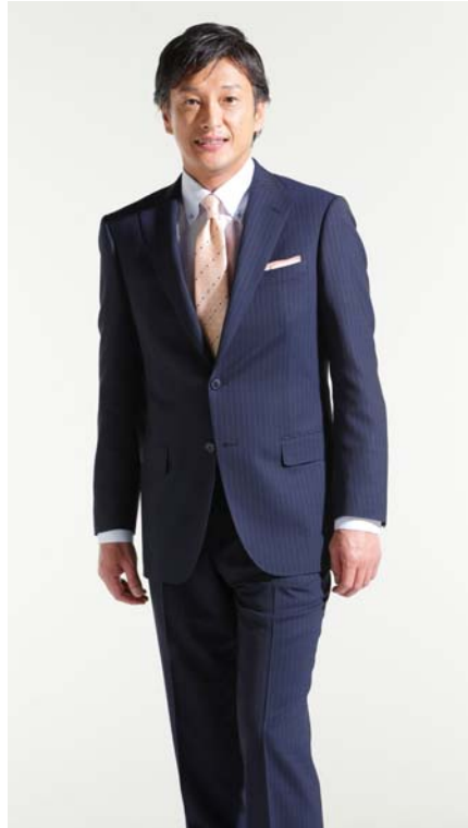
熱遮蔽機能サーモグラフィー比較 東洋紡株式会社調べ

「熱遮蔽」機能スーツには、繊維メーカー4社の4素材(下記参照)を使用し、「REGAL」、「CHRISTIAN ORANI」、「KANSAI YAMAMOTO」、「PERSON'S FOR MEN」の4ブランドで展開します。