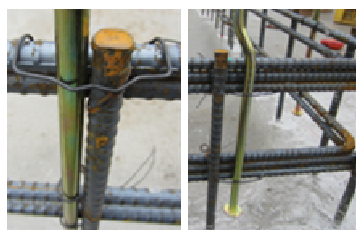
鉄筋が重なっても OK