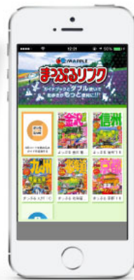
まっぷるリンク エリア別コンテンツダウンロード数