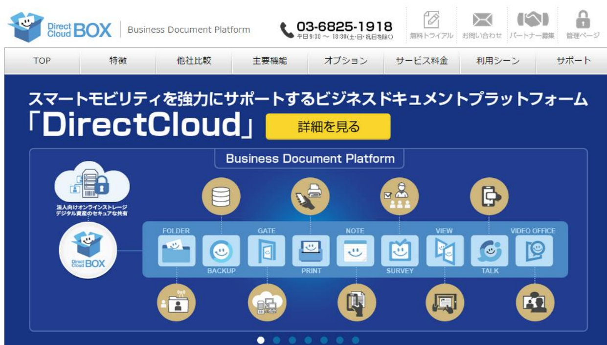
*DirectCloud ホームページのメイン画面