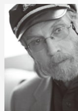
デヴィッド・マッシュューズ

ジャズ本来の即興演奏を活かしたステージが大好評の川嶋哲郎。その超絶技巧、渾身のブロー、息をのむようなインタープレイ、絶妙なスイング感で聴衆をうならせてきた。圧倒的な人気を誇り、なんと4年連続の出演となる。