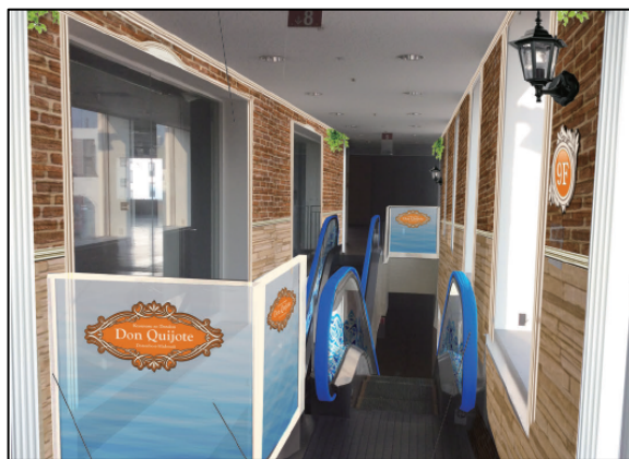
「ドン・キホーテ道頓堀御堂筋店」 店内イメージ