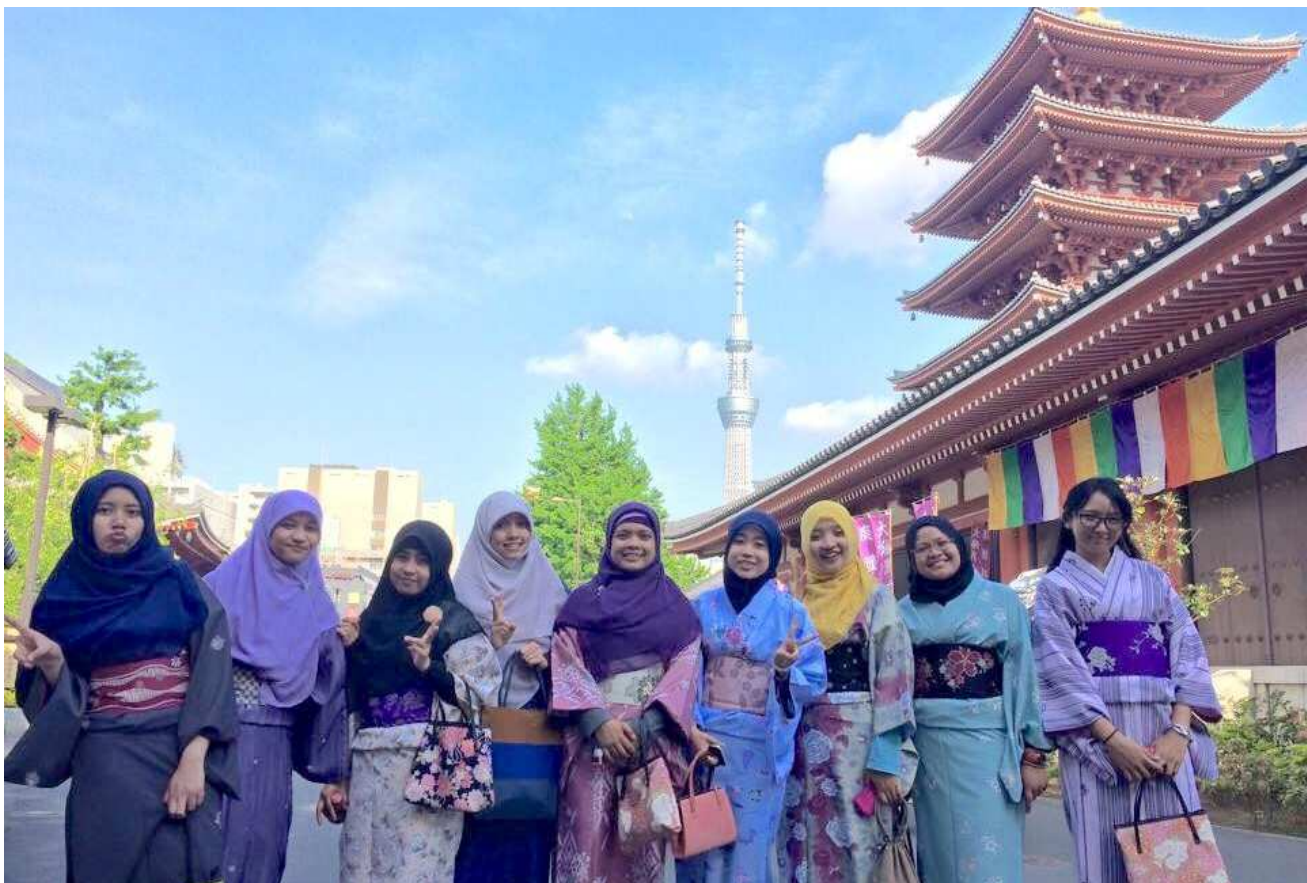
＜2015年4月29日 浅草ムスリムウォーキングツアーvol.2の様子（約50名のムスリム参加）＞