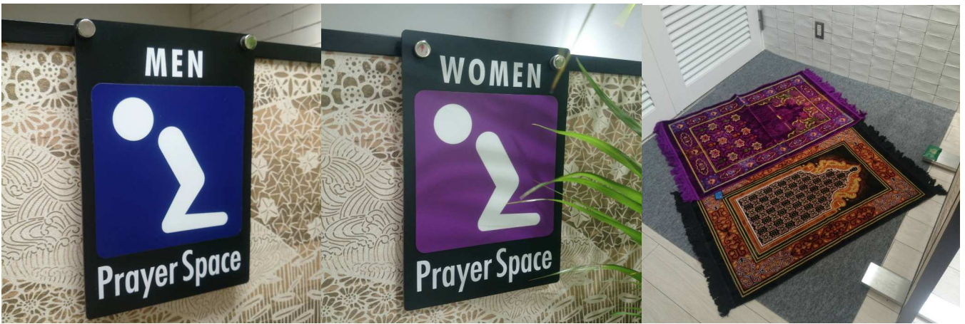
<ラオックス新宿本店の展示販売、ムスリムスタッフ、及び、礼拝スペース>