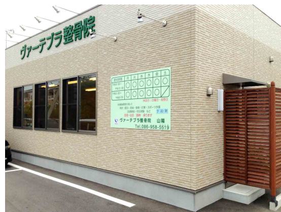
ヴァーテブラ整骨院 山陽店