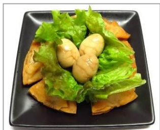
■商品名：餃子で出来てる？！覗いてみよう、恐竜の巣 ■価格：680円 ■店舗：全国たれ比べ餃子