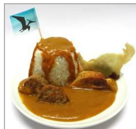
■商品名：恐竜の時代にタイムトリップ！溢れ出る火山カレー ■価格：780円 ■店舗：鉄なべ荒江本店

＜タイアップ先のご紹介＞ 「恐竜 in ナンジャタウン」は、「福井県立恐竜博物館」とのタイアップにより実現したイベントです。