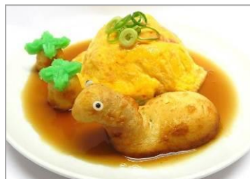
■商品名：海の中からプレシオサウルス現る！天津飯プレート ■価格：750円 ■店舗：羽根付き餃子の共演