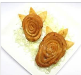
■商品名：発見！恐竜の足跡餃子 ■価格：600円 ■店舗：華興