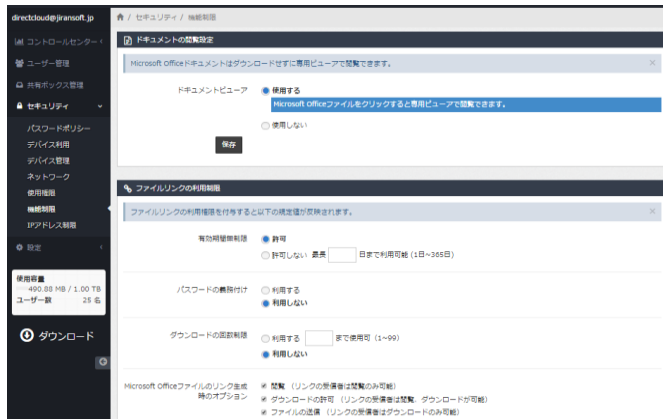
管理ページの専用ビューアの設定画面イメージ