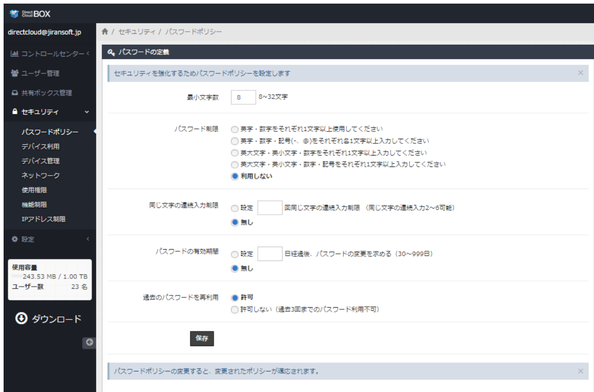
管理ページのセキュリティポリシー画面イメージ