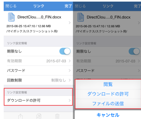
モバイル版でリンク生成時の画面イメージ