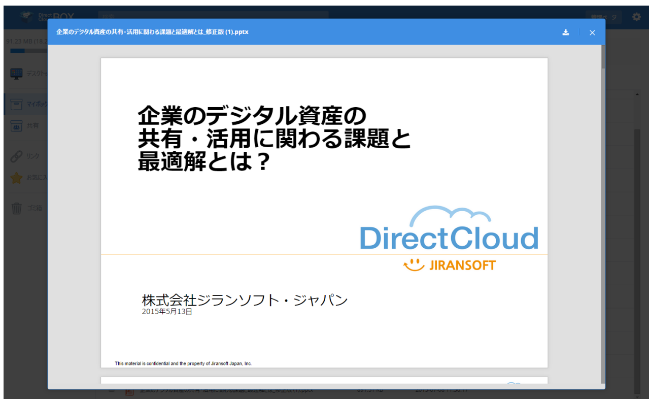
WEB版の専用ビューアでOFFICEドキュメントを開いた画面イメージ