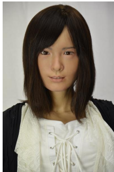
美少女アンドロイド「ASUNA」登場！