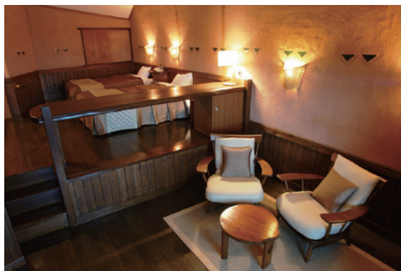
手作りのあたたかみを感じられるゲストルーム