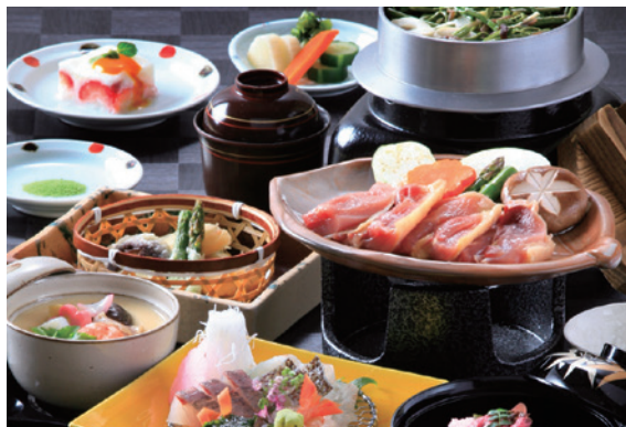
地産地消の心を大切にしたレストランメニュー