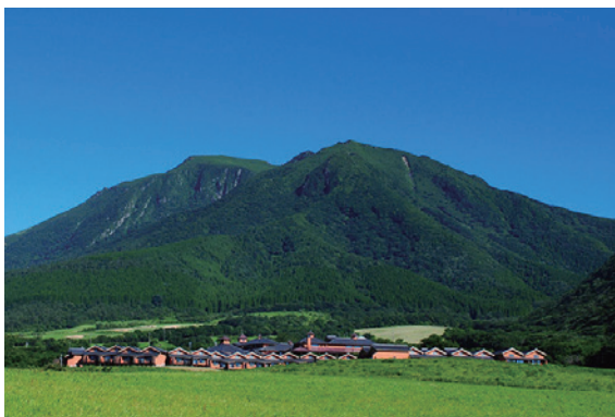
久住高原の大自然に溶け込む設計

＜客室数：洋室46室、和洋室12室／レストラン2タイプ「メテオ」「和心」／大浴場1ヶ所、貸切風呂各3ヶ所＞