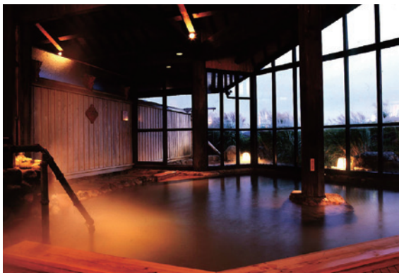
久住の自然が生み出した良質の温泉