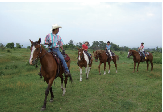
ここでしか体感できないアクティビティ